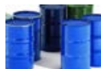
BIDONES 200 L No ADR y ADR