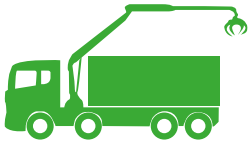
4 ejes + pluma