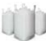
SACAS BIG BAG 1,2 ADR y 1,6 NORMAL