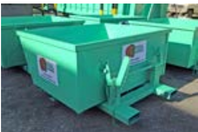
CONTENEDORES a medida