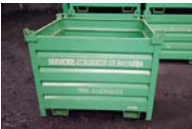
CONTENEDORES PEQUEÑOS SEN