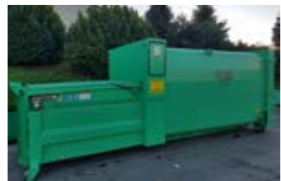
AUTOCOMPACTADORES PRENSAS EXTERNAS