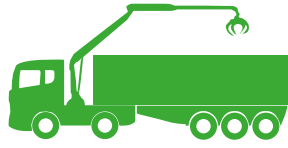
Trailer + pluma